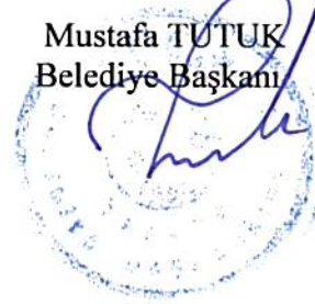
Mustafa TUTUK Belediye Başkanı