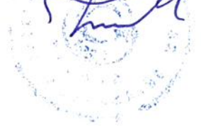
Mustafa TUTUK Belediye Başkanı