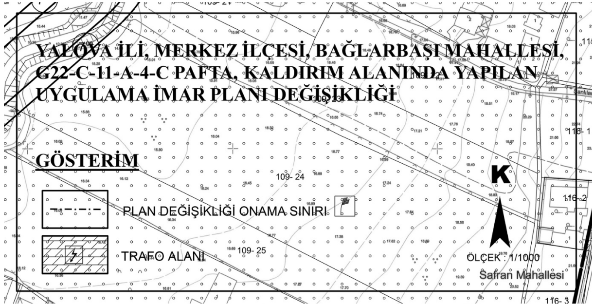
Pafta-2: 1/1000 Ölçekli Uygulama İmar Planı Değişikliği